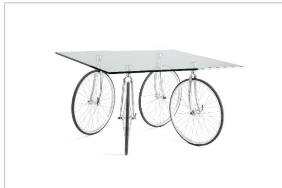
Gae Aulenti, Tour , 1993

Desde los años sesenta, la producción de numerosos tipos de plásticos permitió diseñar muebles con cualquier forma imaginable. Muchas de las piezas de mobiliario creadas por los miembros del movimiento de diseño radical italiano tienen proporciones absurdas y formas fantásticas, inspiradas directamente en la obra de los surrealistas. Por otro lado, los artistas surrealistas no abandonan el diseño